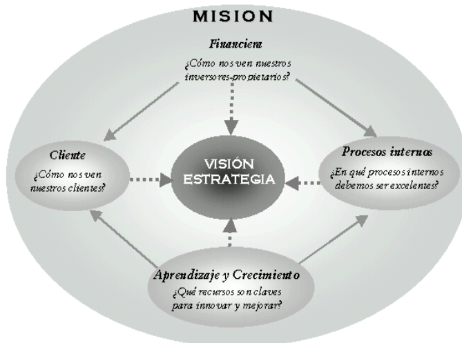
Figura 2: El Tablero de Comando.

Hay que reconocer que el Tablero de Comando posee ventajas y desventajas, aunque la herramienta requiere su adaptación a la realidad propia del ente, para aprovechar todo su potencial. En ese sentido la empresa debe ser capaz de adaptar el Tablero de Comando a los cambios y necesidades en la información a obtener y medir, y en este proceso el contador público y el sistema contable tienen un rol preponderante.