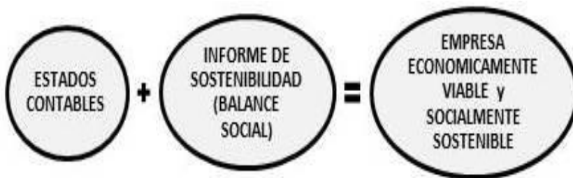
Figura 4: Complementariedad entre Estados Contables y Balance social.

Recordemos que el Balance Social, tal como lo prevé el Global Reporting Institute (GRI) en la Guía para la elaboración de Memorias de Sustentabilidad busca evaluar tres aspectos que hacen a la sostenibilidad de la empresa en el medio como son las dimensiones económicas, sociales y ambientales, de acuerdo a la figura 4 siguiente: